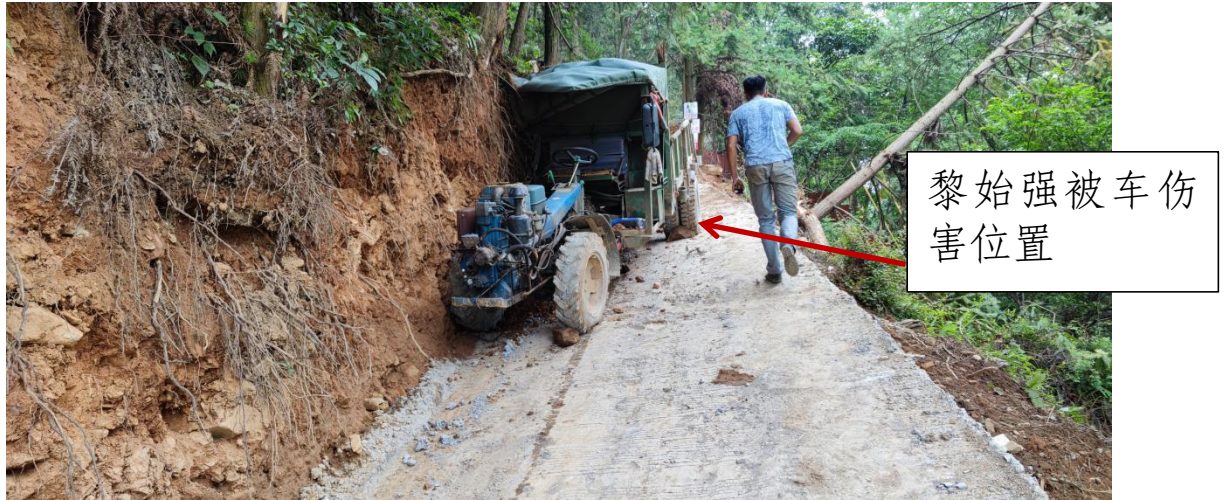
图 3：2021 年 8 月 22 日事发时黎*强拖拉机实拍图