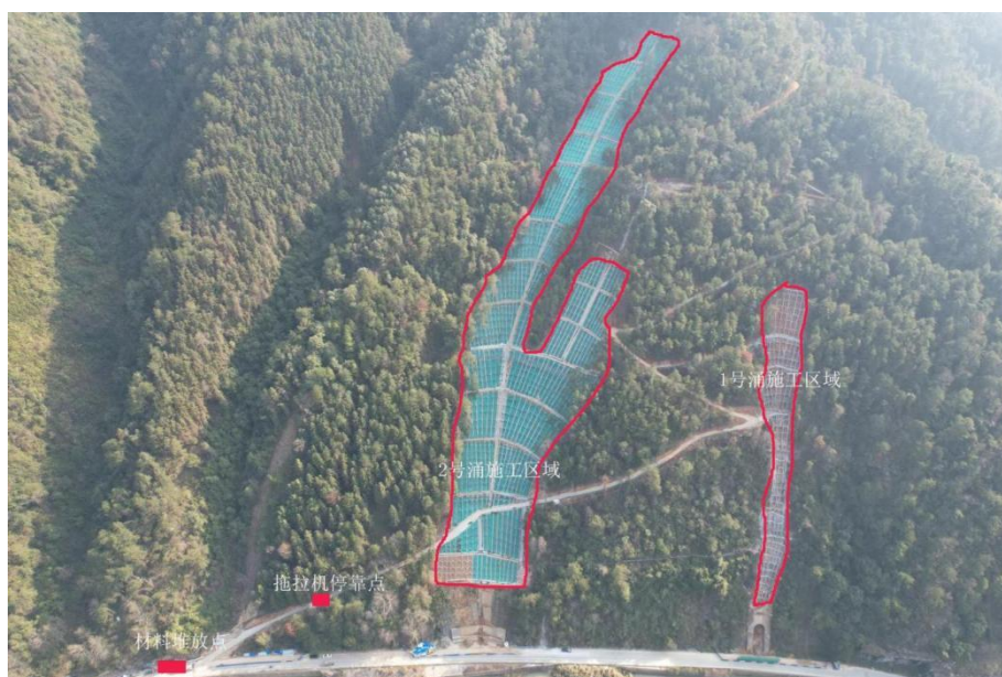
图 2: 广东省乐昌市乐昌峡库区两岸生态修复工程（一期）1 号修复点航拍图